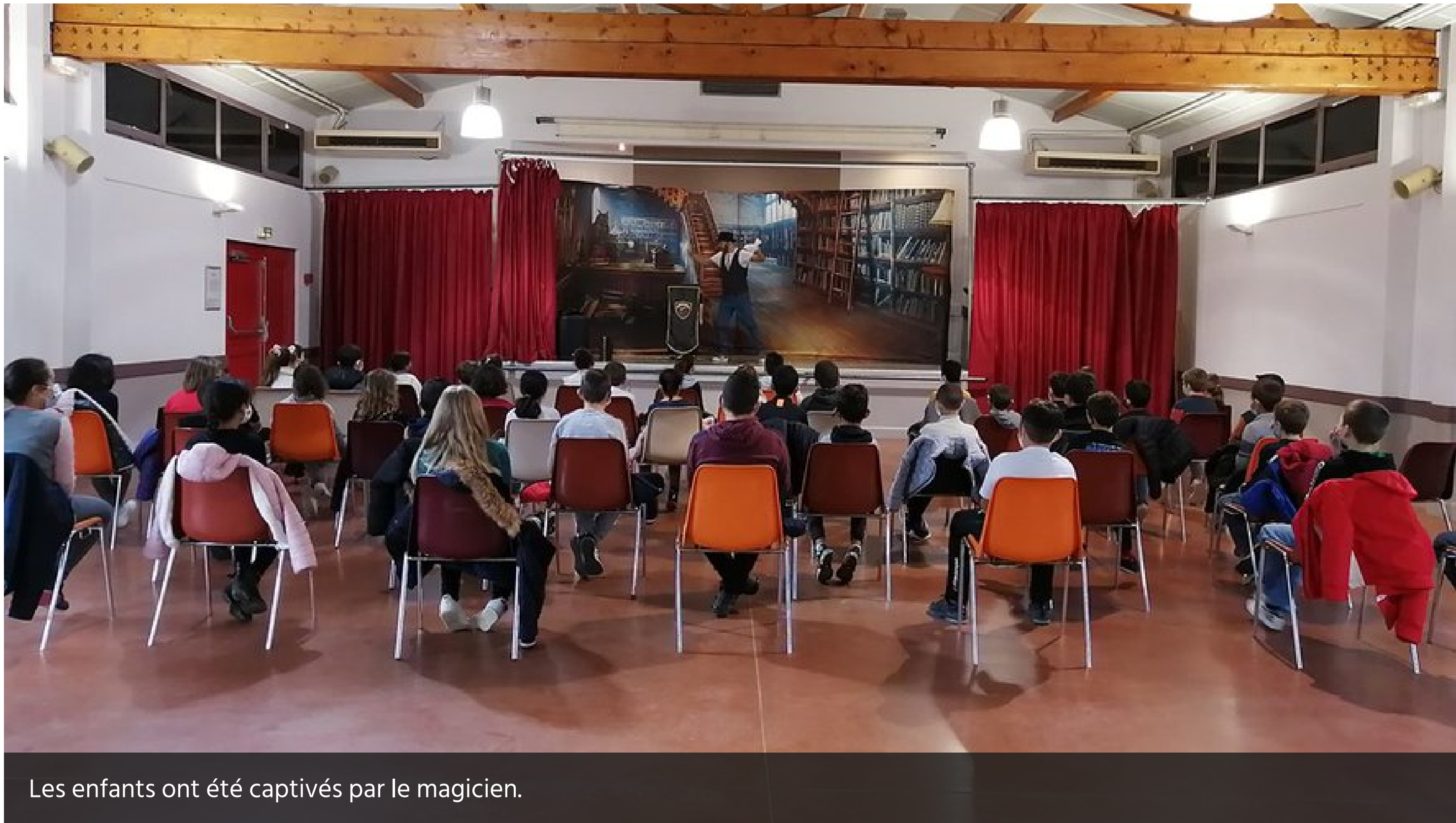
Les enfants ont été captivés par le magicien.